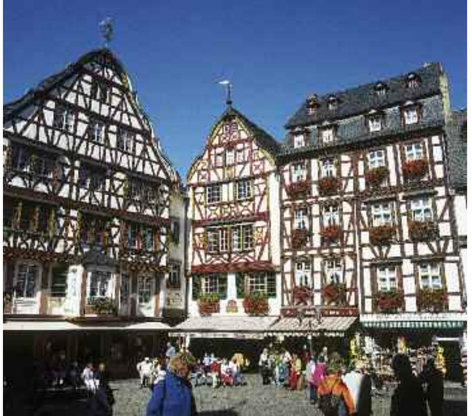
Bernkastel-Kues – Marktplatz