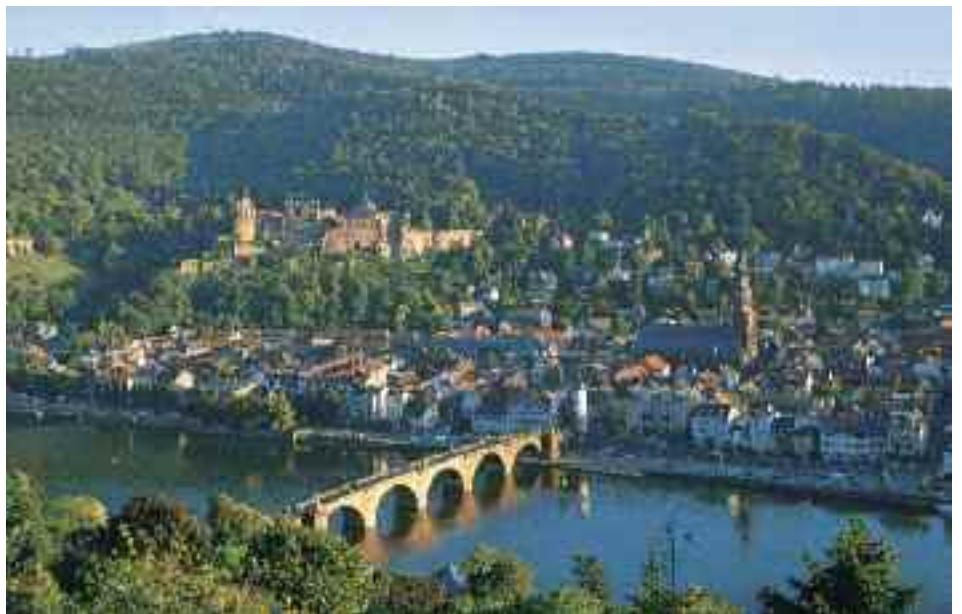
Heidelberg am Neckar

Nach dem frühen Ablegen Fahrt rheinabwärts und anschließend auf dem Neckar bis nach Heidelberg , das wir gegen Mittag erreichen. Heidelberg gilt als eine der schönsten Städte Deutschlands. Das harmonische Ensemble von Schloss, Altstadt und Fluss inmitten der Berge inspirierte bereits die Dichter und Maler der Romantik und fasziniert auch heute Millionen von Besucherinnen und Besuchern aus aller Welt. Überzeugen Sie sich selbst bei einem geführten Stadtrundgang vom einzigartigen Charme dieser Stadt. Am späten Nachmittag fährt das Schiff schon wieder neckarabwärts zum Rhein und erreicht gegen Mitternacht Worms .