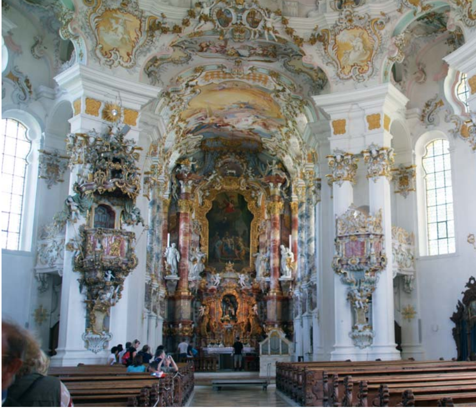
Wies – Wallfahrtskirche