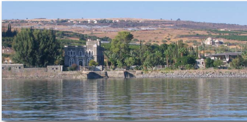
See Gennesaret – Kafarnaum