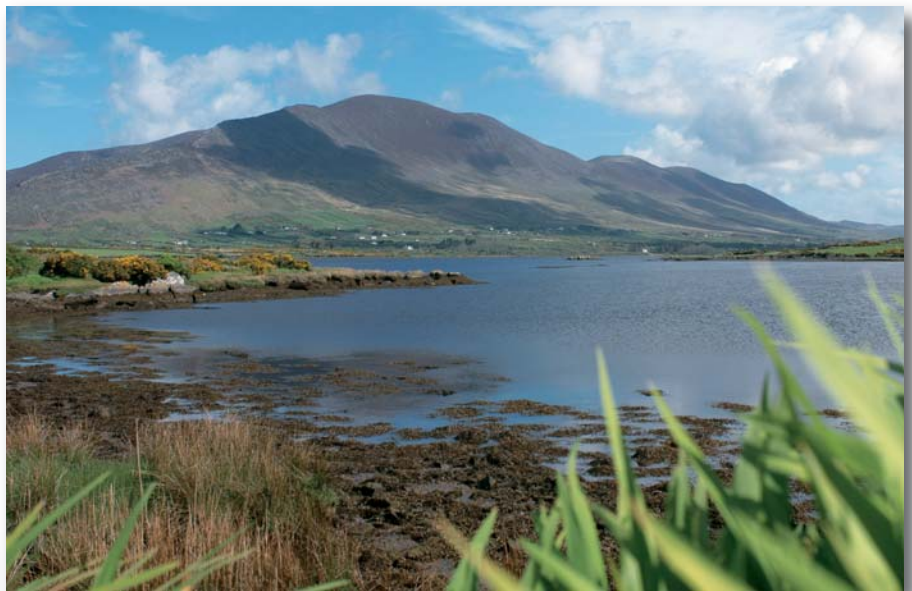
Am Ring of Kerry

Fahrt zum Rock of Cashel, der von den gewaltigen Mauern einer mittelalterlichen Burg-, Kirchen- und Klosteranlage gekrönt wird: Die Cormac's Chapel im hiberno-romanischen Stil ist ein Kleinod irischer Architektur und Steinmetz-