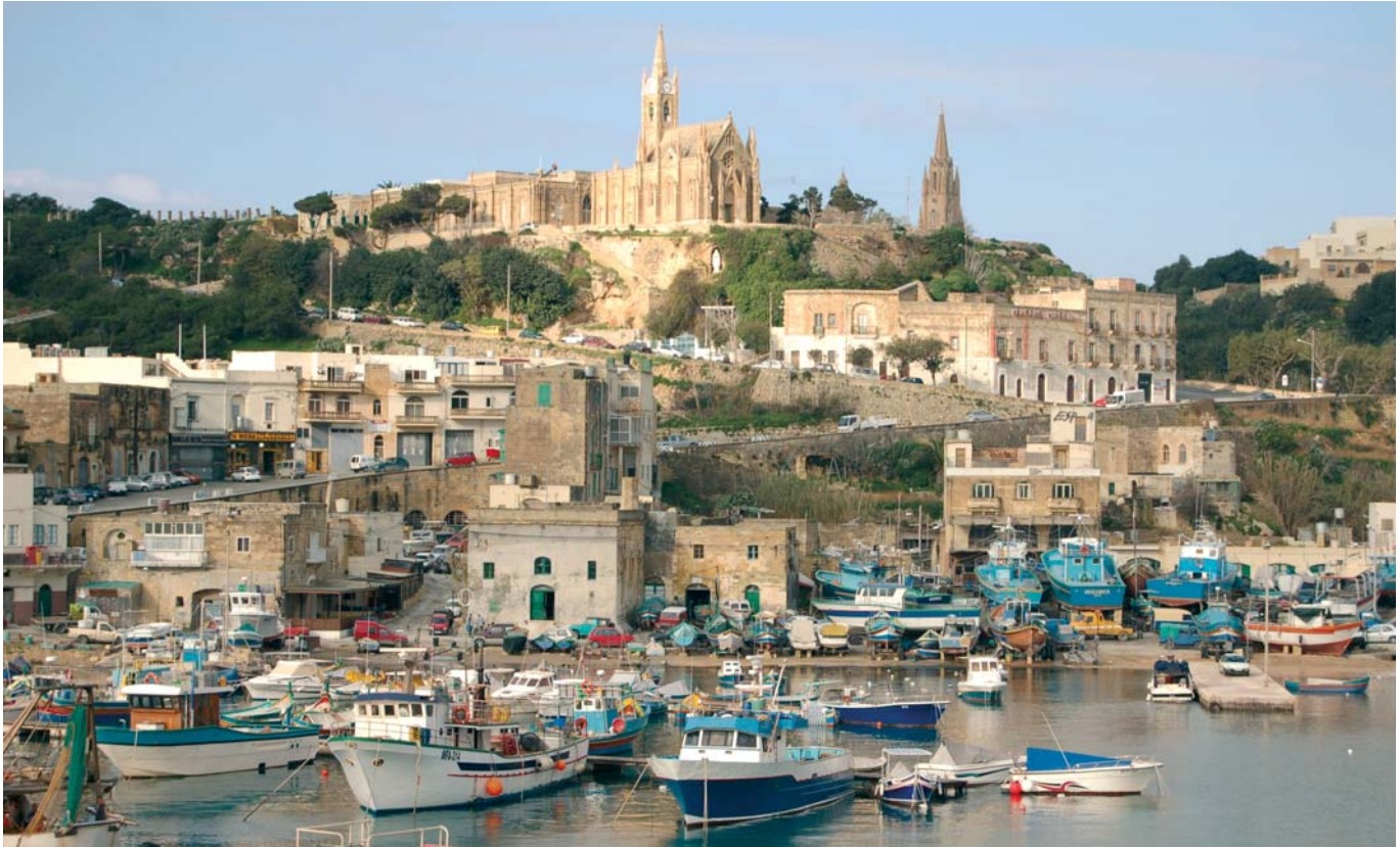
Mgarr auf Gozo

Vor 6000 Jahren errichteten Maltsas Bewohner aus riesigen Steinblöcken die Tempel der Großen Mutter. Phönizier, Karthager, Römer, Araber, Johanniter und zuletzt die Briten prägten das Gesicht der Insel wesentlich. Wer Malta besaß, hatte den „Schlüssel zum Mittelmeer“. In einer Woche erschließen wir Ihnen von einem Standort aus die Geschichte Maltsas, führen zu den traditionellen Gedenkorten des Schiffsbruchs Pauli und frühchristlichen Heiligtümern. Zwei Tage stehen zur freien Verfügung und bieten Zeit zur Erholung oder für weitere Ausflüge, u.a. zur Nachbarinsel Gozo.