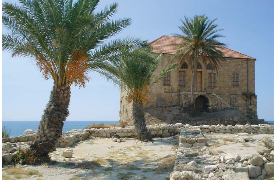
Byblos – Archäologenhaus

Die Zeder des Libanon befindet sich nicht nur auf dem Staatswappen. Sie ist Symbol der Geschichte des Landes; sie steht für Reichtum, Fruchtbarkeit und Beständigkeit. Die Zeder schlägt die Brücke zwischen Vergangenheit, Gegenwart und Zukunft des Landes. Wir stellen Ihnen auf dieser Reise die Heimat der Phönizier vor und ein Land, das in vielerlei Hinsicht den Hintergrund der biblischen Geschichte bildete. Es sei nur an Hiram, den König von Tyrus und „Hoflieferanten“ Salomos, an das Wirken Elijas bei der Witwe in Sarapta oder an die Begegnung Jesu mit der Syro-Phönizierin erinnert. Seit dem Bürgerkrieg der letzten Jahre befindet sich das Land im Wiederaufbau. Eine schöne Küstenlandschaft, herrliche Gebirge und fruchtbare Täler heißen Sie willkommen. Denn zumindest landschaftlich ist der Libanon noch immer die „Schweiz des Nahen Ostens“. Und er ist ein Land, wo Christen und Muslime miteinander leben und neue Wege in die Zukunft suchen.