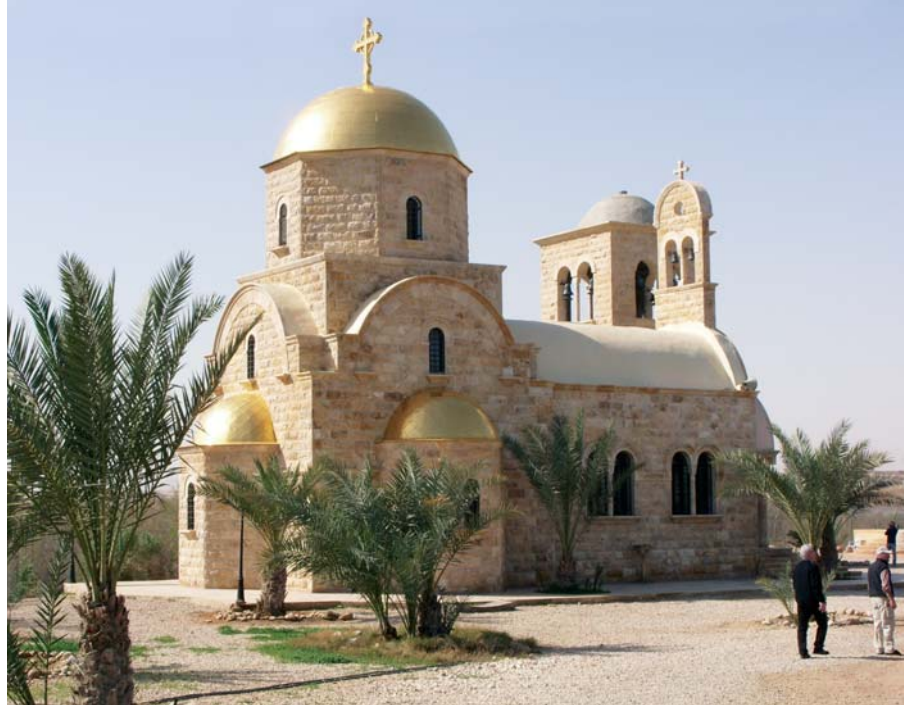
Taufstelle am Jordan

Aus dem Orient kommt das Licht! Dennoch liegt die Geschichte und insbesondere die biblische Bedeutung des Ostjordanlandes für viele weitgehend im Dunkeln. Diese Studienreise soll dazu dienen, diese Geschichte ein wenig zu erhellen und erlebnisreich näher zu bringen. Einzigartige Landschaften und teilweise unbekanntere Routen erhellen nach und nach Stationen der religiösen Entwicklung: von den Wüstenerfahrungen spannt sich der Bogen über die Zeit der Landnahme zu Elija, Johannes dem Täufer und Jesus bis hin zur Geschichte der frühen Kirche. Die Nabatäer-Hauptstadt Petra ist vielleicht die großartigste Ruinenstätte der Antike, deren Tempel und Opferplätze direkt aus dem Stein herausgemeißelt wurden. Das Wadi Rum schließlich erinnert an Lawrence von Arabien. Unsere Rundreise erschließt Ihnen alle Orte, die für die Geschichte dieses Landes von Bedeutung sind.