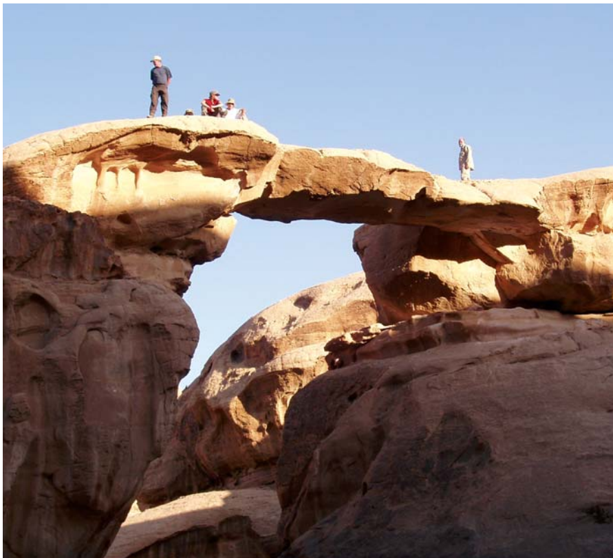
Wadi Rum – Felsenbrücke von Umm Fruth