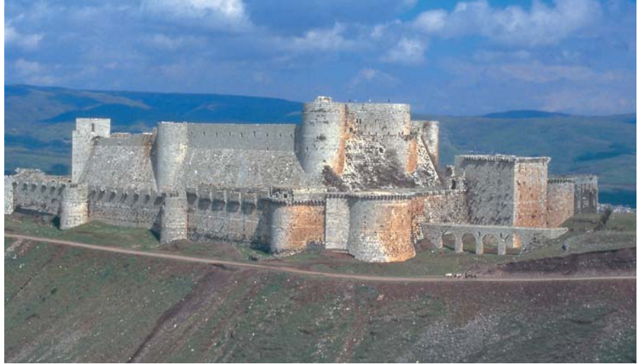
Krak des Chevaliers