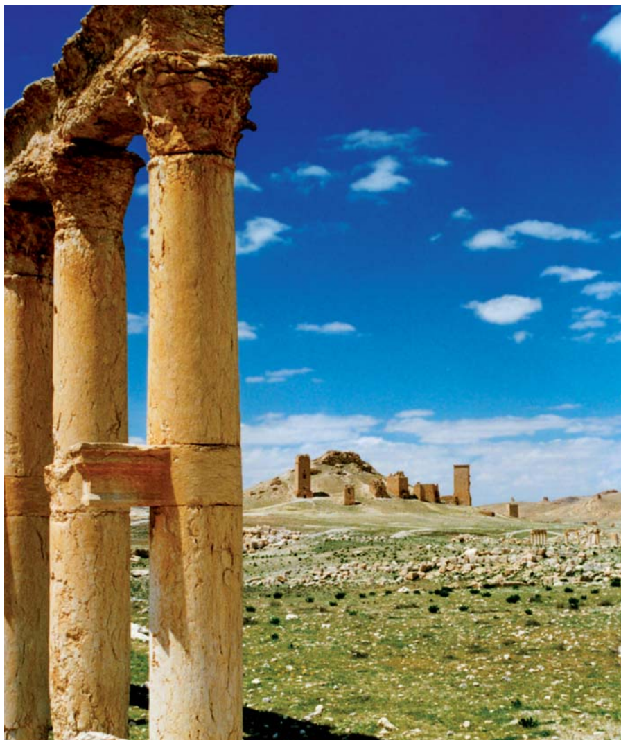
Palmyra – Grabtürme

Fahrt zum Flughafen von Damaskus: Rückflug nach Frankfurt/M.