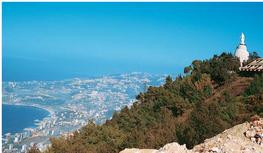
Harissa und Bucht von Jounié

Fahrt nach Tripoli, von den Phöniziern gegründet und zweitgrößte Stadt des Landes. Gang durch die Altstadt mit ihren orientalischen