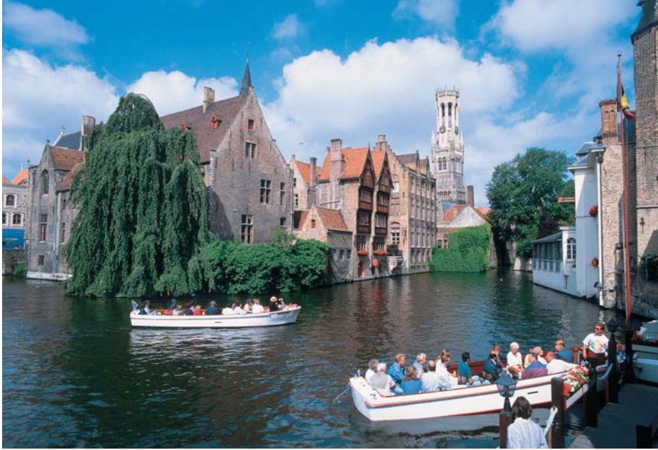
Brügge – Rozenhoedkai