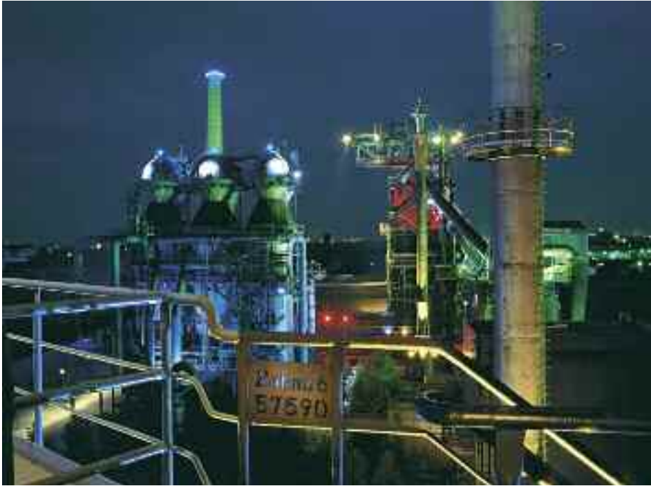
Landschaftspark Nord in Duisburg

ist nun auch in Dortmund angekommen und bleibt über Nacht im Hafen liegen.