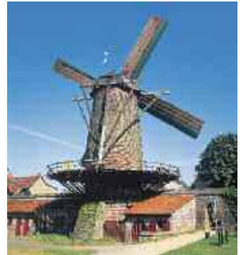
Xanten – Alte Windmühle

Programmänderungen aus technischen Gründen möglich. Fahrplanänderungen des Schiffes bleiben vorbehalten. Wenn wegen Niedrig- oder Hochwasser eine Strecke nicht befahren werden kann, behält sich die Reederei das Recht vor, die Gäste auf dieser Strecke mit Bussen zu befördern. Dies gilt auch bei etwaigen Schiffsdefekten.