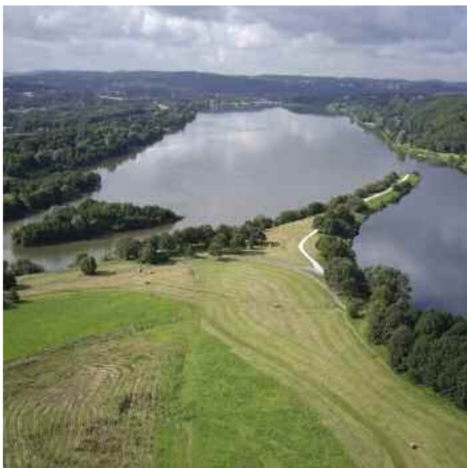
Die Ruhr bei Bochum Kemnade

Morgens Schifffahrt auf dem Wesel-Datteln-Kanal über Haltern am See bis zum Dortmund-Ems-Kanal. Auf diesem weiter bis zum Schiffshebewerk Henrichenburg . Während das Schiff die neue Schleusenanlage passiert, besichtigen wir das alte Schiffshebewerk von 1899 (Museum), eines der spektakulärsten technischen Bauwerke dieser Region. Am Nachmittag Busausflug nach Dortmund : Die Stadt am Hellweg besitzt mit St. Reinoldi , St. Marien und St. Petri mehrere außerordentliche mittelalterliche Kirchen (darin u.a. Marienaltar des Conrad von Soest, Antwerpener Schnitzaltar). Das Schiff